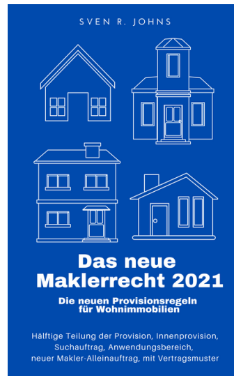
e-Book "Das neue Maklerrecht 2021"