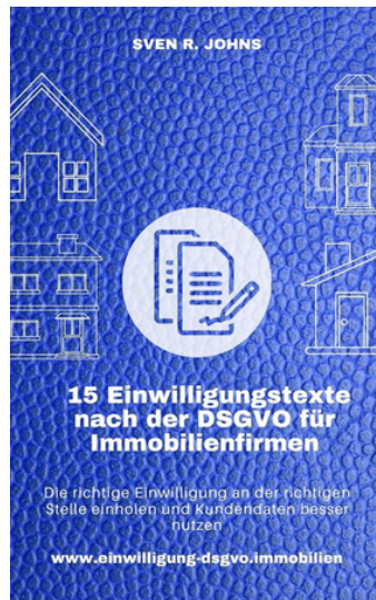
e-Book 15 Einwilligungen