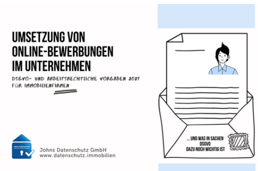
e-Book "Fragen im Bewerbungsverfahren"